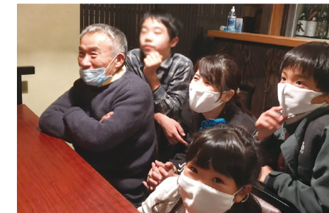
子どもたちも大喜び!