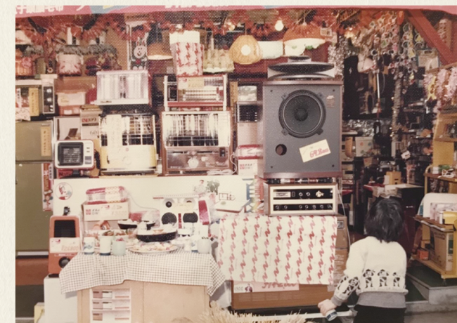
●懐かしい家電たちが見えます。ストロボも。

妙見坂の団地では夕暮れ時に、近所の奥さん方が子どもたちと一緒に外へ出てきて井戸端会議を始めるんです。ある時、僕はそれを見て「ここにベンチがあったらええやろうな」と思って、ベンチを10個以上寄付させてもらいました。まあその代わりにベンチの背にはうちの店名入れてPRさせてもらったけれどね。そやからお客さんと一緒に僕らも歳を重ねてきて、いまだにお付き合い頂いているありがたいお客さんもいてはるんです。