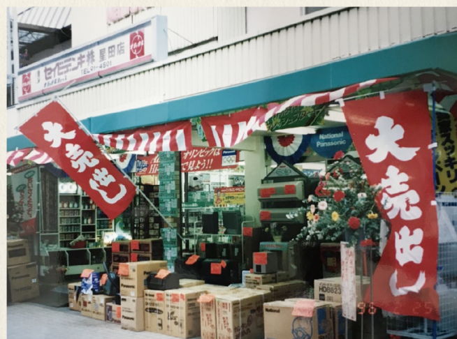
●セイビデンキ星田店 覚えてくださってる方もおられるかと思えます。

僕はいつも、どうやったら喜んでもらえるやろ?どうやったら楽しんでもらえるやろ?常によく観察してそればかり考えていました。