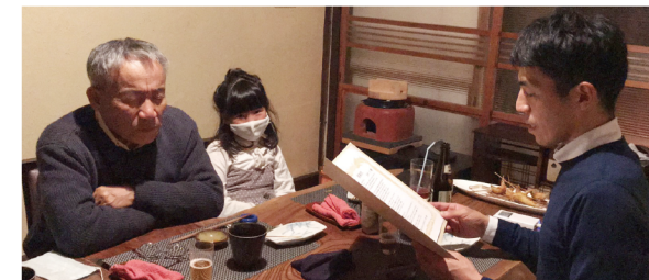
感謝状を読み上げる社長

途中抜粋 父さんが生んでくれたさくらには地元でも皆知る会社になりました。 電気屋さんとして40年間地域の家族の方を大切にしてきた証です。 誰とも仲良くなれる父さんは、この町の人々に愛されてきましたね。 いつも周りを気遣う父さんは、さくらのスタッフに親われて、楽しいモノを探すのが得意な父さんは、家族、孫たちの人気者。そして、どんな時も母さんのことを大切にしてきました。 言いたいことたくさんあっても我慢して、必ずチャレンジさせてくれ、さくらがどん底で傾きかけたときも、笑顔で見守ってくれていました。 経営がしんどかった時期を知っている人は、会社にほとんど居ませんが、さくらの大切な理念「家族の絆を深める会社」生き様は受け継いでいきますので、安心してください。 「しんどい人たちの支えになるう、父さんのように『見守れる』人間になりたい!」と思い生きてきました。厳しくて、温かい人柄でたくさんの人を幸せにしてきた父さん。 感謝しています。